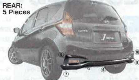
REAR: 5 Pieces

▲フロント、リアとも部品は各5ピースに分割されているものの、全体としての一体感をうまく演出している。