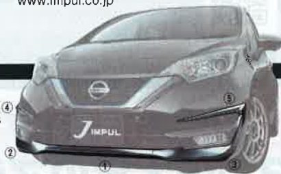
FRONT: 5 Pieces